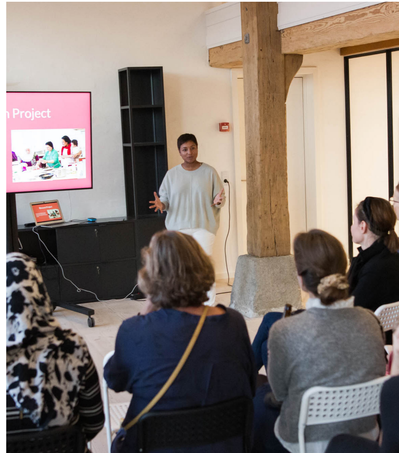
Frivilligafte i Blossom